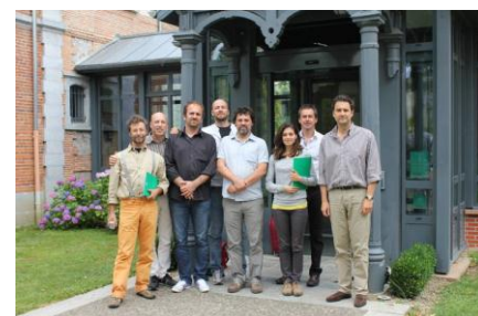
Delegacion Tramontana au Parc Nacionau de las Pireneas